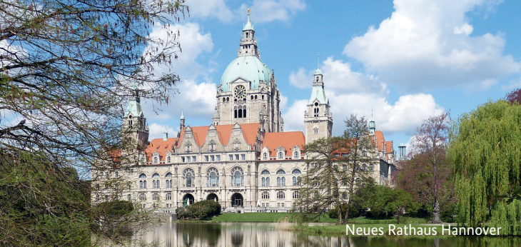
Neues Rathaus Hannover